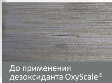
До применения дезоксидаанта OxyScale®