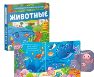
کتاب هایی با عناصر متحرک