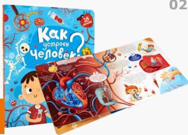
کتاب پنجره دار