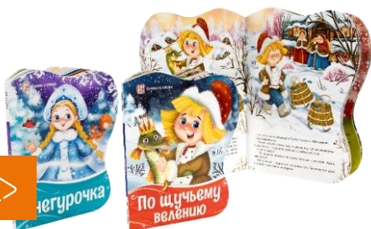
کتاب های مقوایی