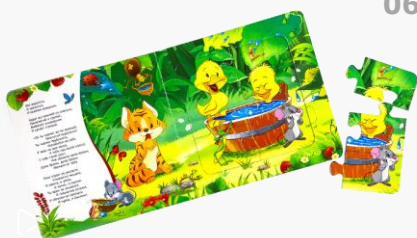
کتاب های پازل دار