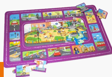
پازل های مقوایی